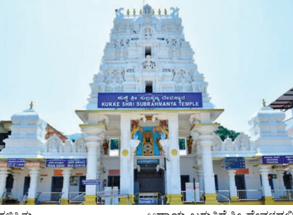
ಗಳಿಸಿತ್ತು. ಹಲವಾರು ವರ್ಷಗಳಿಂದ ನಿರಂತರವಾಗಿ ಆದಾಯ ಗಳಿಕೆಯಲ್ಲಿ ರಾಜ್ಯದ ನಂಬರ್ ವನ್ ದೇವಸ್ಥಾನವಾಗಿ ಹೊರಹೊಮ್ಮಿರುವ ಕುಕ್ಕಿಯು ಈ ಬಾರಿ 146.01 ಕೋಟಿ ರೂ ಆದಾಯ ಗಳಿಸುವ ಮೂಲಕ ಸತತವಾಗಿ ನಂಬರ್ ವನ್ ಸ್ಥಾನವನ್ನು ಗೆಚ್ಚಿಗೊಳಿಸಿದೆ. ಉಳಿದಂತೆ ರಾಜ್ಯ ಮಜರಾಯಿ ಇಲಾಖೆಯ ವ್ಯಾಪ್ತಿಗೆ ಒಳಪಟ್ಟ ಕೊಲ್ಲೂರು ಮುಕಾಂಬಿಕಾ ದೇವಳ 68.23 ಕೋಟಿ ರೂ, ನಂಜನಗೂಡು ಶ್ರೀಕಂಠೇಶ್ವರ ದೇವಸ್ಥಾನ 30.73 ಕೋಟಿ ರೂ, ಸವದತ್ತಿ ರೇಣುಕಾ ಯಲ್ಲಮ್ಮ 25.80 ಕೋ ರೂ, ಮಂದಾರ್ತಿ ದುರ್ಗಾ ಪರಮೇಶ್ವರಿ ದೇವಸ್ಥಾನ 15.27 ಕೋ.ರೂ, ಕೊಪ್ಪಳ ಜಿಲ್ಲೆ ಹಲಿಗುಡು ದೇವಸ್ಥಾನ 16.29 ಕೋ.ರೂ, ಫಾಟಿ ಸುಬ್ರಹ್ಮಣ್ಯ ಸ್ವಾಮಿ ದೇವಸ್ಥಾನ 13.65 ಕೋ ರೂ, ಬೆಂಗಳೂರಿನ ಬನಶಂಕರಿ ದೇವಸ್ಥಾನ 11.37 ಕೋ ರೂ ಆದಾಯ ಗಳಿಸಿದೆ.

ಸುಬ್ರಹ್ಮಣ್ಯ: ಪ್ರಸಿದ್ಧ ನಾಗರಾಧನೆಯ ಪುಣ್ಯ ಕ್ಷೇತ್ರ ಸುಬ್ರಹ್ಮಣ್ಯದ ಪವಿತ್ರ ಕುಕ್ಕೆ ಸುಬ್ರಹ್ಮಣ್ಯ ದೇವಾಲಯವು 2023-24ನೇ ಸಾಲಿನ ಆರ್ಥಿಕ ವರ್ಷದಲ್ಲಿ 146.01 ಕೋಟಿ ರೂ ಆದಾಯ ಗಳಿಸಿದೆ. 2023 ಎಪ್ರಿಲ್‌ನಿಂದ 2024 ಮಾರ್ಚ್ 31ರ ತನಕದ ಆರ್ಥಿಕ ವರ್ಷದಲ್ಲಿ ದೇವಳಕ್ಕೆ ಈ ಆದಾಯ ಲಭಿಸಿದೆ. ಈ ಮೂಲಕ ಸತತ 13ನೇ ವರ್ಷ ಆದಾಯದಲ್ಲಿ ರಾಜ್ಯದ ನಂಬರ್ ದೇವಳವಾಗಿ ಮುಂದುವರಿದಿದೆ. ಕಳೆದ ವರ್ಷ ಶ್ರೀ ದೇವಳವು 123 ಕೋಟಿ ಆದಾಯ