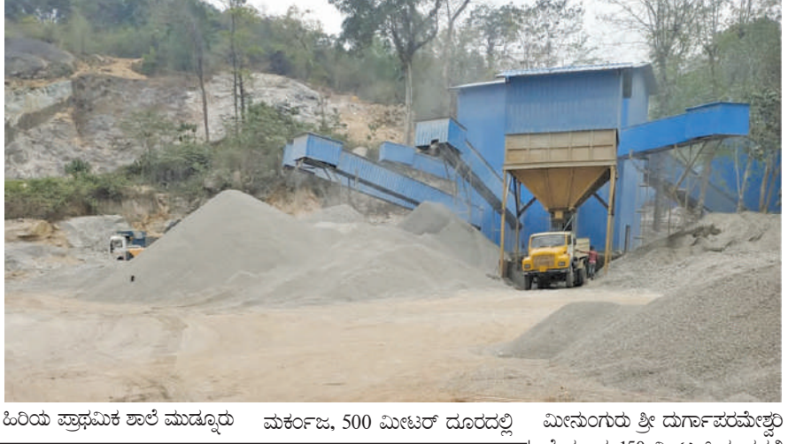
ಹಿರಿಯ ಪ್ರಾಥಮಿಕ ಶಾಲೆ ಮುಡೂರು ಮರ್ಕಂಜ, 500 ಮೀಟರ್ ದೂರದಲ್ಲಿ ಮೀನುಗಾರು ಶ್ರೀ ದುರ್ಗಪರಮೇಶ್ವರಿ ದೇವಸ್ಥಾನ, 150 ಮೀಟರ್ ದೂರದಲ್ಲಿ ಹರಿಜನ ಕಾಲೋನಿ, 150 ಮೀಟರ್ ದೂರದಲ್ಲಿ ಕುಡಿಯುವ ನೀರಿನ 2 ಕೋವೆ ಬಾವಿಗಳು ಮತ್ತು ನೀರಿನ ಟ್ಯಾಂಕ್ ಸರಕಾರಿ ಆಸ್ಪತ್ರೆ, 400 ಮೀಟರ್ ದೂರದಲ್ಲಿ ಮರ್ಕಂಜ ಪ್ರಾಥಮಿಕ ಕೃಷಿ ಪತ್ತಿನ ಸಹಕಾರಿ ಸಂಘ, ಯುವಕ ಮಂಡಲದ ಕಟ್ಟಡ ಇರುತ್ತವೆ. ಒಂದು ವರ್ಷದ ಹಿಂದೆ ತೋಟೆ ಬಳಸಿ ಗಣಿಗಾರಿಕೆ ಮಾಡಿರುವುದರಿಂದ ಮೀನುಗಾರು ಶ್ರೀ ದುರ್ಗಪರಮೇಶ್ವರಿ ದೇವಸ್ಥಾನ ಗರ್ಭಗಣಿಯು ಒಡೆದಿದ್ದು ಹಾನಿಗೊಂಡಿರುತ್ತದೆ. ಜನನಿಬಿಡವಾದ ಸ್ಥಳದಲ್ಲಿ ಗಣಿಗಾರಿಕೆ ಮಾಡಲು ಅನುಮತಿ ನೀಡಿರುವುದರಿಂದ ಅಳವುಪುರಂ ಪ್ರದೇಶದ ಜನರಿಗೆ ಜೀವನ ನಡೆಸಲು ದುಸ್ಥರವಾಗಿರುತ್ತದೆ. ಕಲ್ಲುಕೋರೆಯಲ್ಲಿ ಸ್ಥಳೀತನು ತೋಟೆಗಳ ಭೇಟು ಸ್ಥಳೀತಕ್ಕೆ ವಾಸ್ತವ್ಯದ ಮನೆಗಳು, ಅಂಗಡಿಗಳ ಗೋಡೆಗಳು ಹಾನಿಗೊಂಡಿದ್ದು ನಾಗರಿಕರು ವಾಸಿಸಲು ಭಯಭೀತರಾಗುವಂತಾಗುತ್ತದೆ. ಟಿಪ್ಪಣಿ ಲಾರಿಯಲ್ಲಿ ಮೊದಲ ಜಿಲ್ಲಾಧಿಕಾರಿಗಳಿಗೆ ತೆಗೆದುಕೊಂಡು ಹೋಗುತ್ತಿರುವುದರಿಂದ ರಸ್ತೆಯಲ್ಲಿ ಚಿಲ್ಲೆ ಜನರು ನಡೆದಾಡದಂತಾಗಿರುತ್ತದೆ. ಮಾತ್ರವಲ್ಲದ ರಸ್ತೆಯಲ್ಲಿ ಹರಡಿರುವ ಜಿಲ್ಲೆ ಕಲ್ಲಿನ ಹುಡುಗಿಯಿಂದಾಗಿ ಶಾಲಾ ಮಕ್ಕಳು, ಪರಿಸರದ ಜನರ ಆರೋಗ್ಯಕ್ಕೆ

ನೀಡಿರುತ್ತಾರೆ. ಪ್ರಸ್ತುತ ಗಣಿಗಾರಿಕೆ ಮಾಡುತ್ತಿರುವ ಅಜೀಶ್ ಕಾವು, ಡೆಲ್ಟಾ ಎಂಟರ್‌ಪ್ರೈಸಸ್ ಮತ್ತು ಸ್ವಲ್ಪ ಗೌಡ ಮೈಸೂರು ಎನ್ನುವವರು ಕಾನೂನುಬಾಹಿರವಾಗಿ ತೋಟೆಗಳನ್ನು ಬಳಸಿ ಕಲ್ಲುಗಳನ್ನು ಒಡೆಯುತ್ತಿರುವುದರಿಂದ ಪರಿಸರದಲ್ಲಿರುವ ಮನೆಗಳಿಗೆ ಹಾನಿಯಾಗಿದ್ದು ಮನೆಗಳ ಗೋಡೆಗಳು ಒಡೆದಿರುತ್ತವೆ. ಪರಿಸರದ ರಸ್ತೆಗಳಲ್ಲೂ ಹಾನಿಯಾಗಿದ್ದು ರಸ್ತೆಯಲ್ಲಿ ಕಲ್ಲಿನ ಹುಡುಗು ಬಿದ್ದು ರಸ್ತೆಯಲ್ಲಿ ಜನರು ಓಡಾಡದಂತೆ ಆಗಿರುತ್ತವೆ. ಮಾತ್ರವಲ್ಲದ ರಸ್ತೆಯಿಂದ ಒಡೆದು ಕಲ್ಲು ಒಡೆಯುವ ರಸ್ತೆಯ ಧೂಳನ್ನು ತೆಗೆಯುವರೆ ರಸ್ತೆಗೆ ನೀರು ಹಾಕುತ್ತಿದ್ದು ರಸ್ತೆಯಲ್ಲೂ ಕೆಸರುಮಯವಾಗಿರುತ್ತವೆ. ಗಣಿಗಾರಿಕೆ ನಡೆಯುತ್ತಿರುವ ಕೇವಲ 383 ಮೀಟರ್ ದೂರದಲ್ಲಿ ಸರಕಾರ