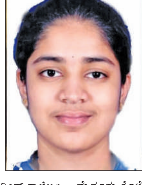
ಮೈಸೂರು ಕೊಳ್ಳೆಗಾಲದ ಸತ್ಯಗಾಲ ಗ್ರಾಮದವರು. ಹಾಗೂ ಪ್ರಥಮ ಶೇಖರ್ 588 ಅಂಕ ಪಡೆದು ರಾಜ್ಯಕ್ಕೆ 11ನೇ ಯಾಂಕ್ ಪಡೆದು ವಿಜ್ಞಾನ ವಿಭಾಗದಲ್ಲಿ ದಾಖಲೆ ನಿರ್ಮಿಸುತ್ತಾರೆ.